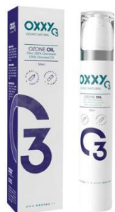
Ozone Oil 800IP